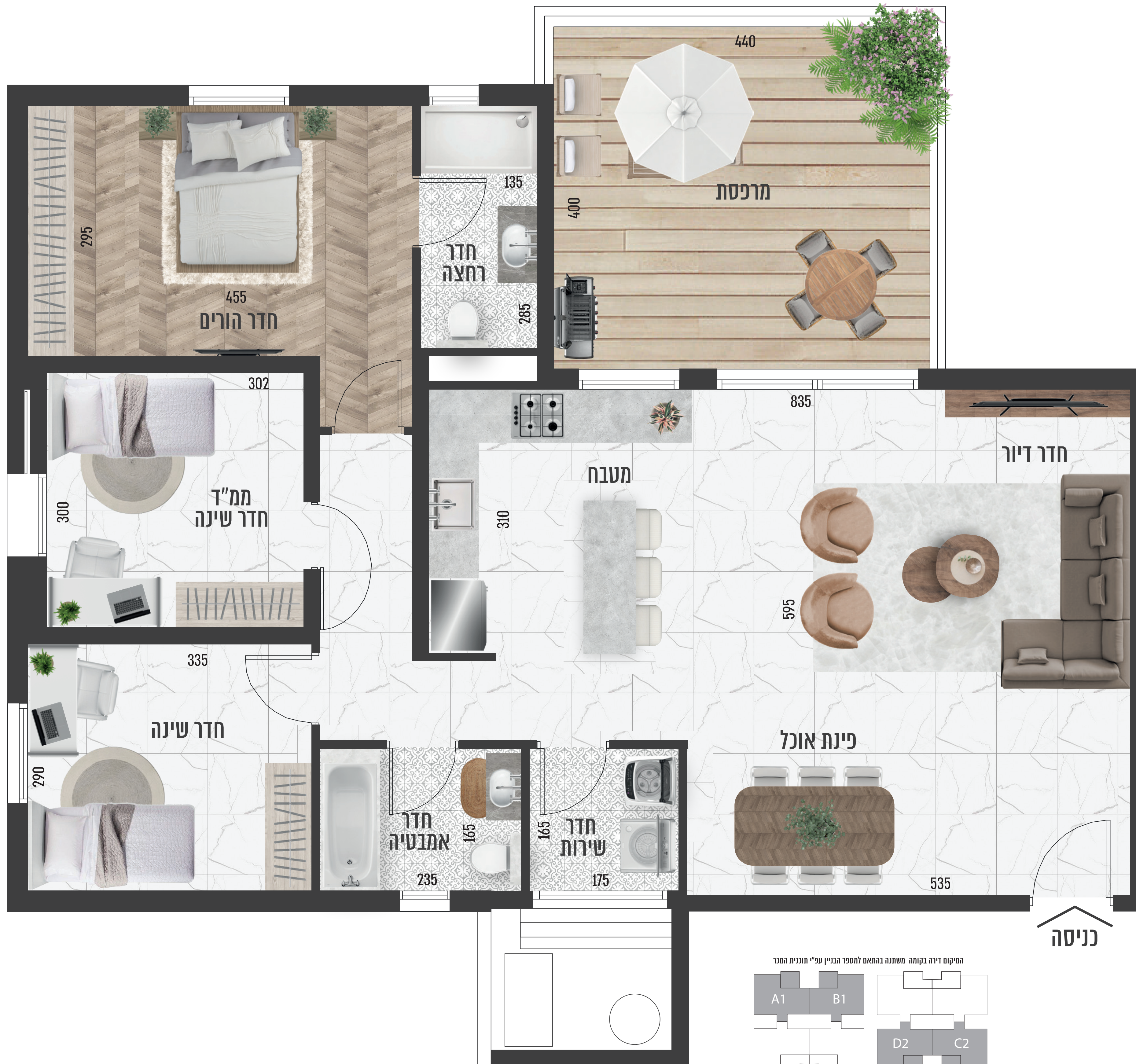
המיקום דירה בקומה משתנה בהתאם למספר הגניין עפ"י תוכנית המכר